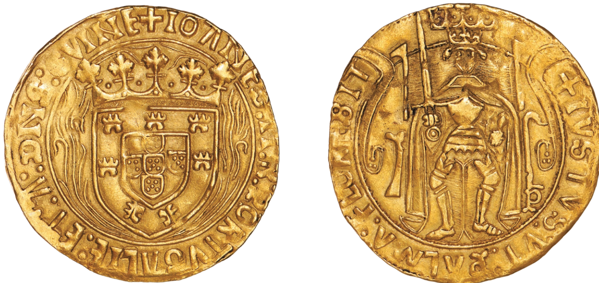
Fig. 1- Justo da Casa da Moeda do Porto (Esc. 2,5:1)

Porto 2 ( Fig. 1 ), assunto que o referido Autor retoma em artigo publicado no mesmo ano (TRIGUEIROS 2015a: 191-94). Por sua vez, as dúvidas de António Trigueiros sobre a genuinidade do Justo do Porto motivaram uma réplica, de publicação recente, de Alberto J. Canto García e Isabel Rodríguez Casanova (CANTO e RODRÍGUEZ 2018), onde, segundo o nosso entendimento, os dois autores espanhóis rebatem com acerto tais argumentos.