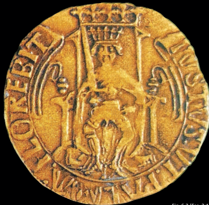
Fig. 6.3 (Esc. 3:1)