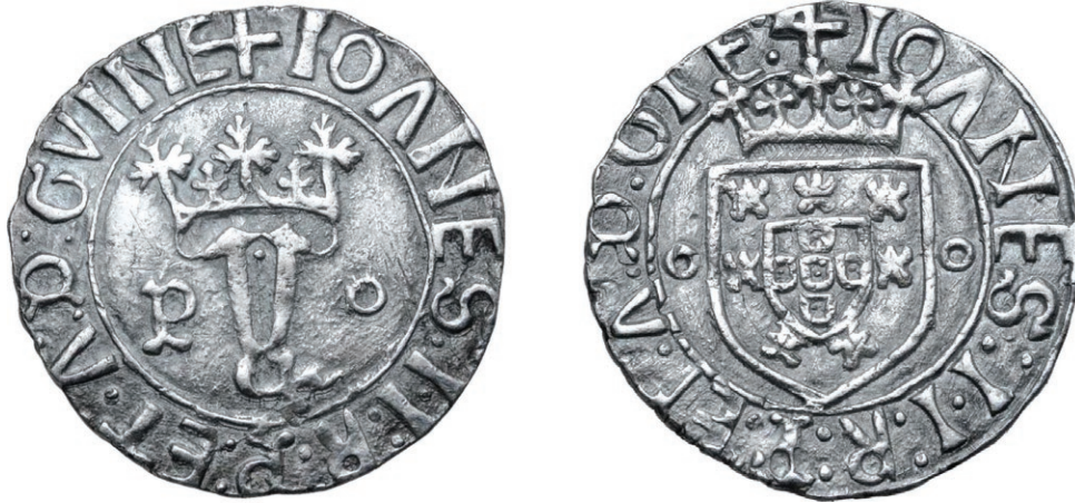
Fig. 2 - Vintém da Casa da Moeda do Porto (GOMES 20.18var) (Esc. 3:1)

observável em alguns Vinténs não é idêntico ao do Justo, senão mesmo saído da mesma mão (Figs. 1, 2 e, sobretudo, 3a-b; cf. também a ilustração de quatro moedas desta série de vinténs apresentada por GOMES entre 20.05 e 20.26a)?