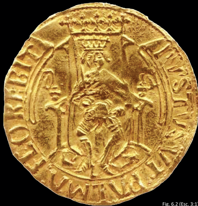
Fig. 6.2 (Esc. 3:1)