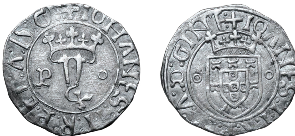
Fig. 4 - Vintém da Casa da Moeda do Porto (GOMES 20.08var) (Esc. 3:1)

Por aqui se conclui que, nestes aspetos técnico-estilísticos, a argumentação de António Trigueiros apresenta grandes debilidades e incongruências, não dão qualquer solidez à proposta da alegada falsidade do Justo do Porto.