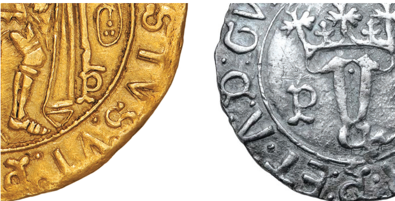
Fig. 3 a-b - Parte das legendas das Figs. 1 e 2, apresentadas aproximadamente com a mesma dimensão para destacar a similitude do desenho dos "PP"

c) finalmente, o estilo do desenho do escudo coroadado no anverso do Justo não apresenta afinidades com alguns representados em emissões coevas de Vinténs portugueses (ainda que, naturalmente, com menos detalhes e cuidado), por exemplo, na forma do escudo e da coroa, na disposição e desenho dos castelos (com três ameias nos vinténs e quatro no Justo, explicável pelo módulo bem maior deste) e das quinas (Fig. 5; cf. também fotografias de GOMES 20.08 e 20.12)?