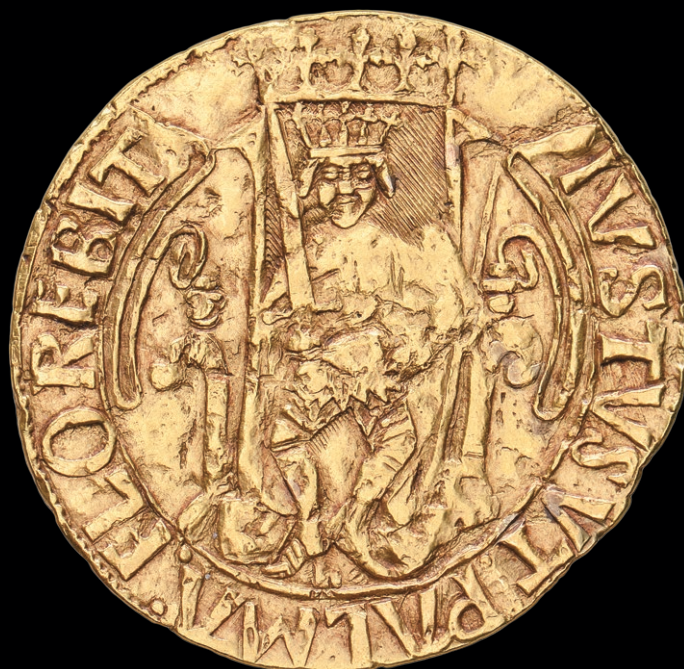
Fig. 6.4 (Esc. 3:1)