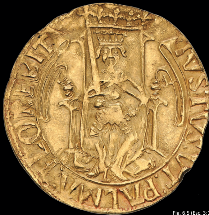
Fig. 6.5 (Esc. 3:1)