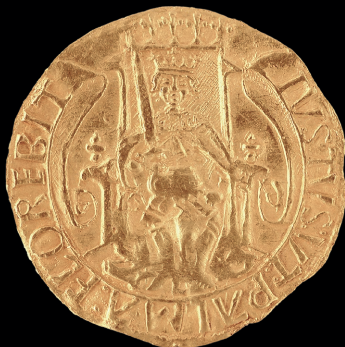
Fig. 6.6 (Esc. 3:1)