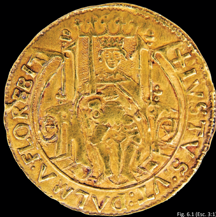
Fig. 6.1 (Esc. 3:1)