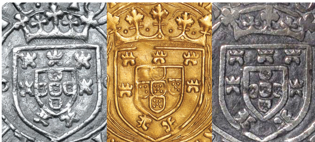
Fig. 5 a-c - Pormenor dos escudos das Figs. 2, 1, e de Numisma 118, lote 160, apresentados aproximadamente com a mesma dimensão para destacar as similitudes do desenho