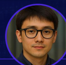
Tevo .be Gerente de Estratégia e Risco