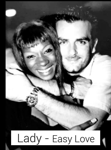
Lady - Easy Love