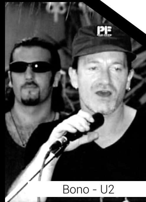
Bono - U2